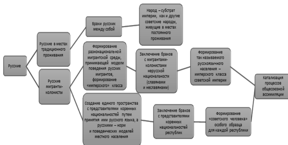
Рис. 2. Роль русских в ассимиляционных процессах в СССР

3. Так шли процессы ассимиляции в СССР, формирования «советского народа», состоящего из «советских наций», поэтому не однородного, но должно быть спаянным общей, но «усеченной» культурой, основанной на общем опыте отрыва от прежних традиций, чему активно способствовали межнациональные браки, основанные на советских традициях-«новоделах».