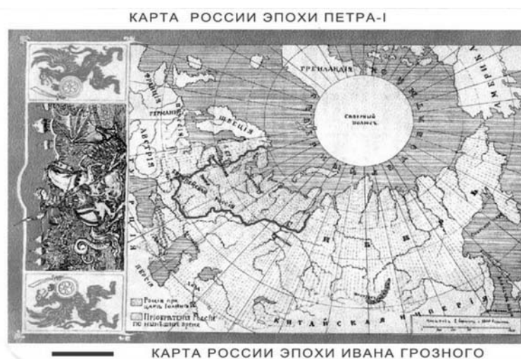
Рис. 29. Карта России эпохи Петра I

Ф.М. Достоевский. Дневник писателя. 1876 (237)