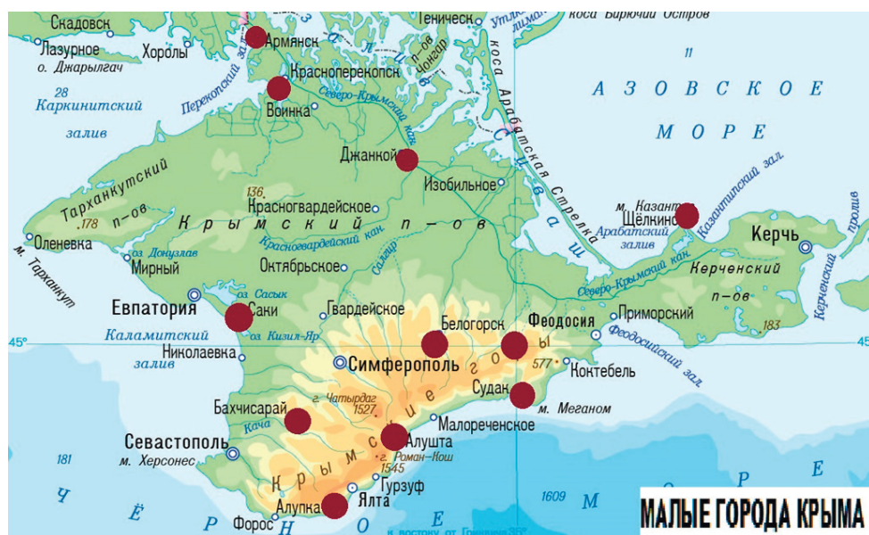
Рис. 1. Малые города на карте Крымского полуострова (выполнено автором)

Территориально малые города Крыма, выступая в качестве активно используемых транспортных центров и связующих звеньев шести районов и семи городских округов, в основном локализованы в южных и центральных регионах полуострова, частично на севере и востоке, не представлены в западной части Крыма.